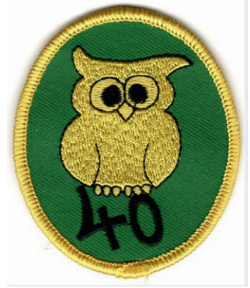
Lippukunnan upea vuosijuhlamerkki kiinnitetään oikean rintataskun yläpuolelle

Lisää partiopuvusta voi lukea Suomen Partiolaisten nettisivuilta.