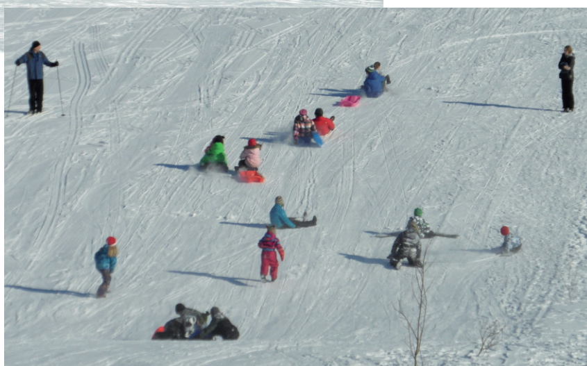
Ryhmäkisan mäenlaskuosuudella lumi pölisi ja pulkkaa kaatui...