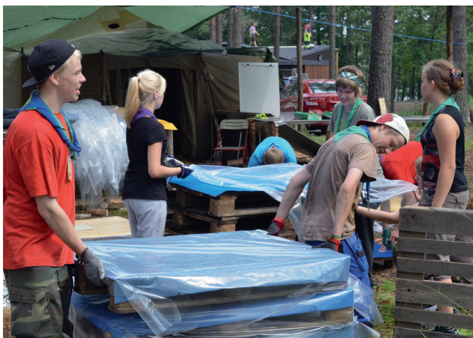
Vaeltajat töissä Huiman rakennusleirillä