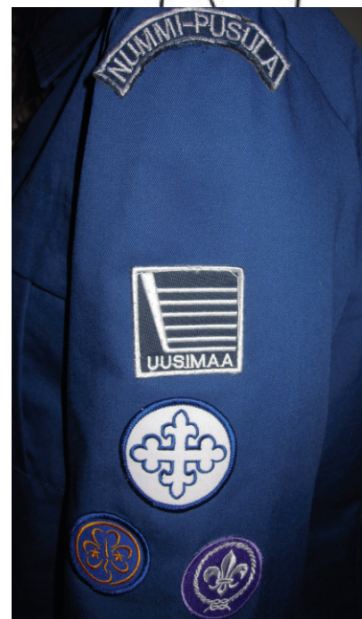
Hihamerkkien järjestys. Tyhjä tila lippukunta- ja aluetunnusta varten