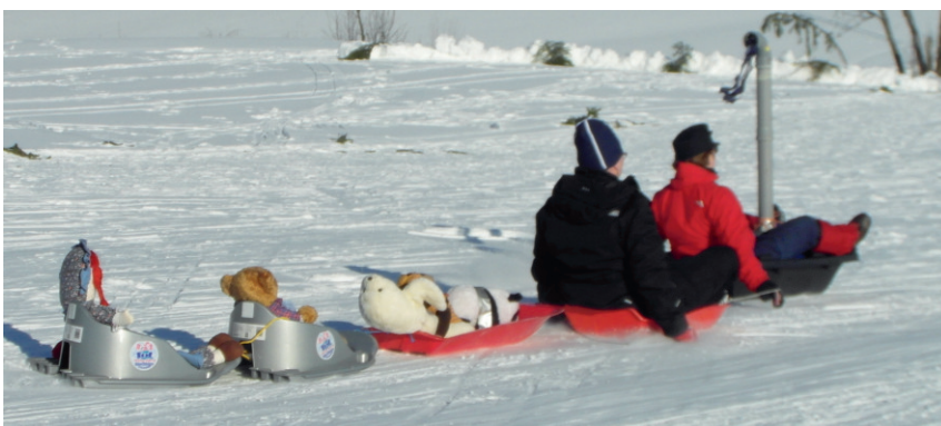
Juna matkustajineen matkalla mäkeä alas