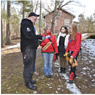
Rastihenkilökoulutuksen rasti- tehtävä.