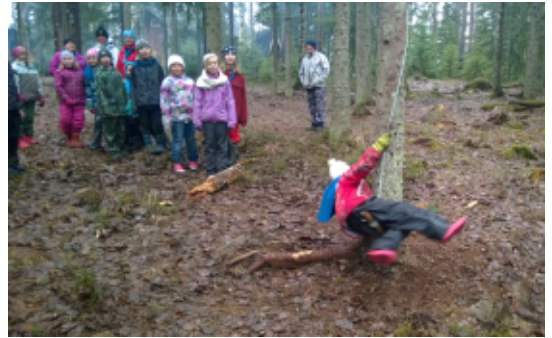
Siililaumalaiset odottamassa keinumisvuoroa esteradalla

Tällä kertaa reippaat Siilit tekivät myös korun, suunnittelivat ja toteuttivat upeita esteratoja, valmistivat lounaaksi maistuvaa ruokaa trangialla sekä paistoivat kodassa tikkupullaa.