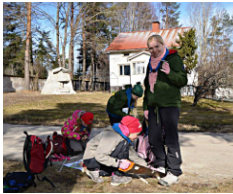
Kotkatytöt Koekisan lähtötehtävää teke- mässä.