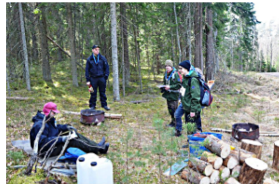
Ahma-vartio ilmoittautumassa kisarastille.