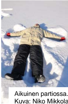
Aikuinen partiossa.